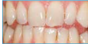
Vor Opalescence® PF