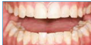
Vor Opalescence Go®