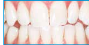
Nach Opalescence® PF