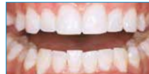
Nach Opalescence Go®